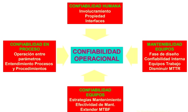
Fig. 3 Confiabilidad Operacional

La figura 3 ilustra un poco más las ideas: